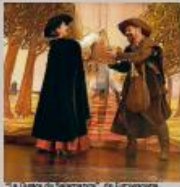
"La Cueva de Salamanca", de Euroscena.

ESPECTÁCULO: "Teatro". COMPAÑÍA: Teatro Consuelo. LUGAR: Espacio Aficio. HORA: 20:00 horas. Duración: 80 minutos. PRECIO: 5 euros.