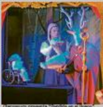
Gloria παρου presenta "Perdida en el bosque".

pequeña historia de amor por la danza, de compañeros, de "tragedias trágicas" que, gracias al esfuerzo, al apoyo del grupo y a la complicidad entre ellos, se resuelven de manera satisfactoria.