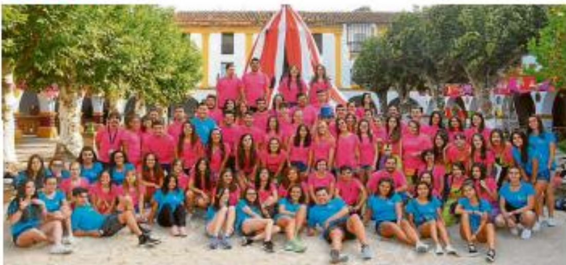
PARTICIPACIÓN. Un centenar de jóvenes se implican directamente en la Feria formando los equipos de monitores y de apoyo.