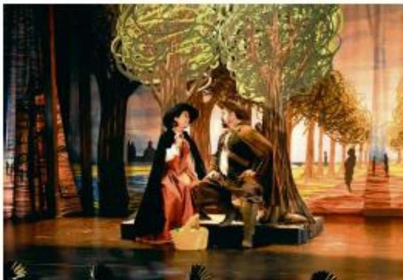
EN SALAMANCA. La obra "La cueva de Salamanca" se presentó en mayo en el Teatro Juan del Encina.

Una Compañía teatral encarga de estas acciones de dos obras diferentes buscando la pieza más adecuada para exhibir durante la celebración del Centenario de la Universidad de Salamanca para el cual se ha convocado un