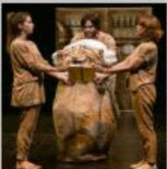
"No hay burras con amor", de Produ. Espasmo.

PUBLICO: 5 euros. PÚBLICO: Público adulto. SINOPSIS: El galán don Juan de Mendoza, atormentado por los obstáculos que encuentra para afirmar su amor con su dama, doña Leonor Enrique, solicita el auxilio de su amigo don Alonso, famoso por su habilidad en las artes de la seducción.