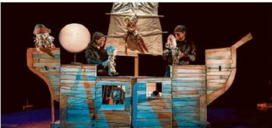
VITERRES. La compañía Teatro Escorpión por primera vez en castellano su nuevo espectáculo de títeres "Adiós, Peter Pan".