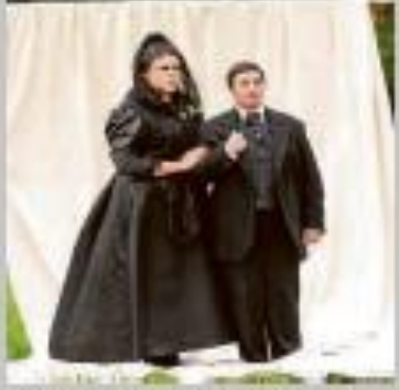
"Ella y Mercala", a cargo de A Paraderia.

ESPECTÁCULO: "Ella y Mercala". COMPAÑÍA: A Paraderia. LUGAR: Patio de Los Sitos. HORA: 23:30 horas. Duración: 80 minutos. PRECIO: 1 euro. PÚBLICO: Público joven y adulto. SINOPSIS: Año 1901, La Coruña. Dos mujeres se casan en la iglesia de San Xurxo, una de ellas vestida de hombre. Una historia de persecuciones políticas, huidas en diligencia, cambios de identidad e informaciones manipuladas. Los cómicos de A Paraderia presentan una reconstrucción itinerante de un suceso real. Una comedia musical donde lo verídico parece un invento. Ella y Mercala es una historia de amor a contratiempo. El montaje obtuvo varios galardones en los Premios María Casares de 2016.