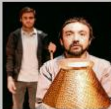
"Cuando caiga la nieve", de La Balloch.

ESPECTÁCULO: "Cibadón". COMPAÑÍA: Espuma Drama. LUGAR: Parque de La Florida. HORA: 20:00 horas. Duración: 50 minutos. PRECIO: Gratuito. PÚBLICO: Todos los públicos.