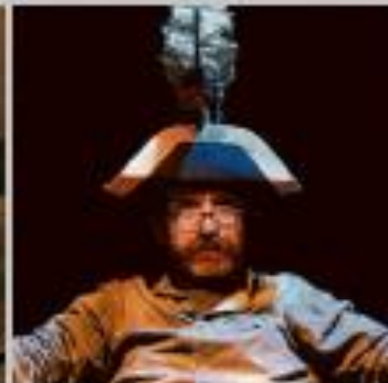
"La coadiv", a cargo de La Chana Teatro.

SINOPSIS: Ulises justifica ante Penélope la tardanza de su retorno. El héroe via mostrando las vicisitudes por las que ha ido pasando contribuyendo para Penélope, junto con la musa Caliope, al teatrito de sus aventuras.