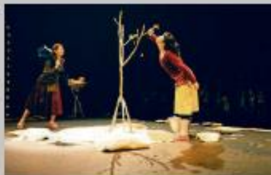
Teatro Sifos hace su estreno absoluto del montaje "La luna en el jardín".