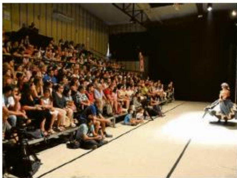
ATRAHANTE. La 21ª Feria de Teatro de Castilla y León se desarrollará entre los días 21 al 25 próximos.

La amplia oferta desplegada por la XXI Feria de Teatro de Castilla y León incluye un total de 15 estrenos, lo que supone un vertido del total. Cuatro de ellos lo son con carácter absoluto: dos de compañías de Castilla y León para público infantil y familiar: