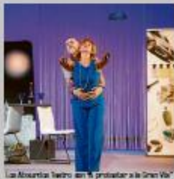
Los Absurdos Teatro en "A panadería de la Gran Via"

ESPECTÁCULO: "Cabe". COMPAÑÍA: Jean Philippe Ciclas. LUGAR: Espacio cerrado en Feria de Sitios. HORA: 21:30 horas. Duración: 45 minutos. PRECIO: 5 euros. PÚBLICO: todos los públicos. SINOPSIS: El montaje se inspira en la situación en la que viven muchas personas carentes de hogar, viajeros involuntarios que se vieron forzados a dejar sus casas, obligados a mendicarse precariamente de sus hogares. ESPECTÁCULO: "Vacas". COMPAÑÍA: Teatrojo. LUGAR: Sala Camarín. HORA: 22:00 horas. Duración: 75 minutos. PRECIO: 8 euros.