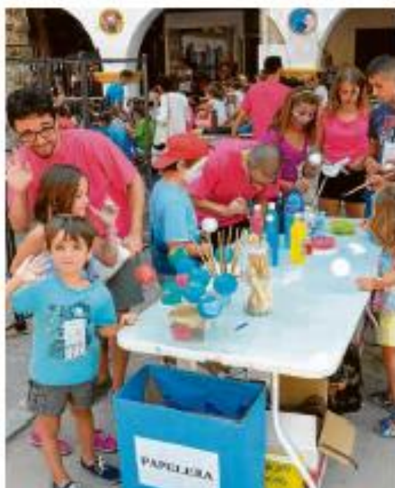
TALLERES. El juego y el arte en parte del "Dívier-teatro".

Los espectadores de la plaza del Juan Alcalde acceden a los diferentes talleres de animación teatral —clases, cajas decoradas, collages, maquillaje, móviles, y sobre las "sin sombrero"—, de participación individual a partir de los seis años, aunque también habrá talleres colectivos que tendrán este año una relevancia singular pues se ofrecen seis propuestas más dirigidas por compañías de Castilla y León y por profesionales del ámbito escénico de nuestra comunidad, complementándose con cuestionarios, teatro de títeres y actuaciones de pequeño formato.