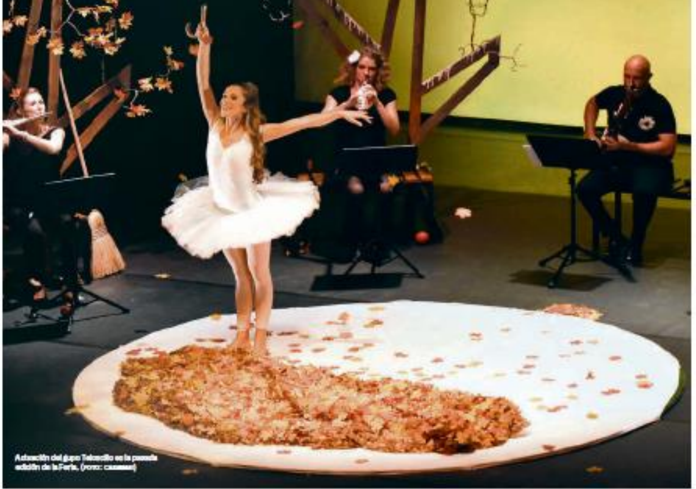
Actuación del grupo Telescillo en la pasada edición de la Feria.

LOS TEMAS SOCIALES Y LA MAYOR PRESENCIA SOCIAL DE LA MUJER SON ESTE AÑO EL SELLO DE LA IDENTIDAD DE LA XXI EDICIÓN DE LA FERIA DE TEATRO DE CASTILLA Y LEÓN