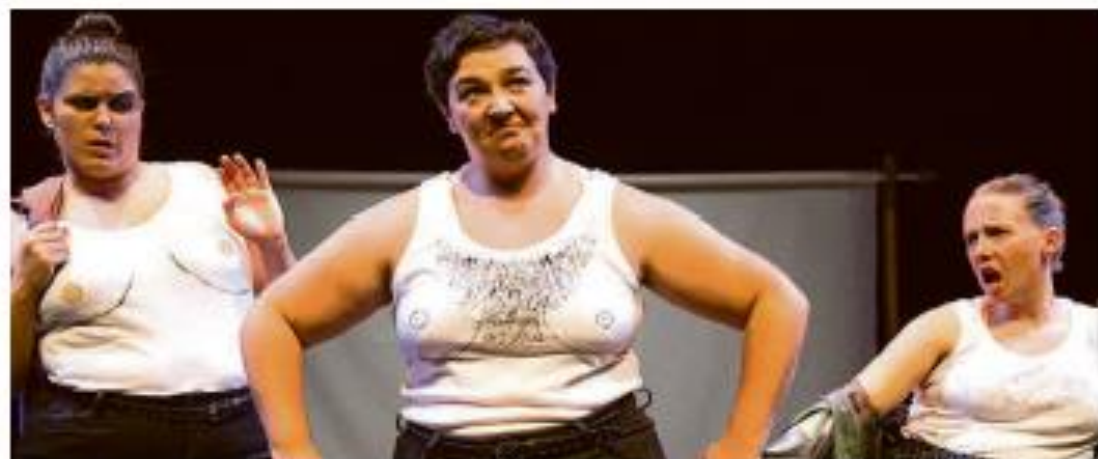
"ELISA Y MARCELA". La compañía gallega A Paradoxa estrena en la Feria un montaje sobre la diversidad y la liberación de las mujeres.

Toda esta edición desde una perspectiva de género se complementará con amplio abanico de actividades educativas y lúdicas de promoción de las artes escénicas dentro del programa de animación infantil Divertiteatro en las mañanas de la Feria.