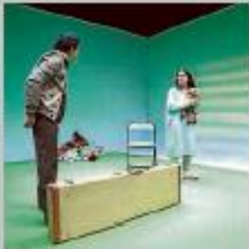
"¿Qué pasó con Michael Jackson?", de La Teta Celva.

SINOPSIS: Esta montaje habla de la soledad, del desierto del Bero teatral. De la necesidad de ser queridos aunque sea una bestia. De formarse un barro de pastillas y alcanzar el mito. Mi funeral va a ser lo más. Nos habla del youtube, del instagram, del buscador de likes. Del desparatado.