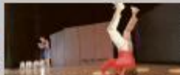
"Frog me xerto...", a cargo de Rudo Interno.