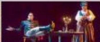
"Inábil", a cargo de Teatro Damaio.