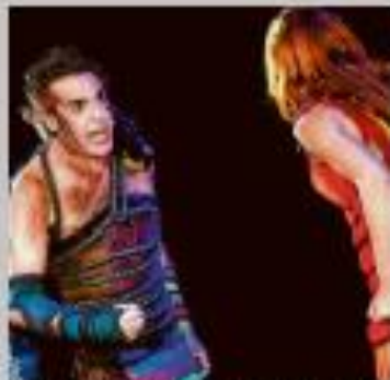
"Viriato", montaje de Verbo Producciones.

ESPECTÁCULO: "Viriato". COMPAÑÍA: Verbo Producciones. LUGAR: Teatro Nuevo "Fernando Arrabal". HORA: 18:00 horas. Duración: 30 minutos. PRECIO: 11 euros. PÚBLICO: Público adulto.