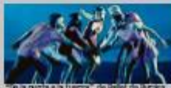
"De la punta a la tierra", de Ballet de Burgos.

ESPECTÁCULO: "De la punta a la tierra". COMPAÑÍA: Ballet Contemporáneo Burgos. LUGAR: Teatro Nuevo "Fernando Arrabal". HORA: 19:00 horas. Duración: 75 minutos. PRECIO: 6 euros. PÚBLICO: A partir de 6 años. SINOPSIS: Desde la perspectiva de cada personaje vemos componiendo una