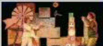
Talandillo Teatro acude con "La Granja".

ESPECTÁCULO: "La Granja". COMPAÑÍA: Talandillo Teatro. LUGAR: Espacio en Rosa. HORA: 11 y 19:30 horas. Duración: 55 minutos. PRECIO: 4 euros. PÚBLICO: De 8 a 4 años. SINOPSIS: Manja la granjera se levanta al cantar el gallo, se quita cuatro legañas y se lava como un gato. Con ella pasaremos un día en su Granja.