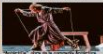
"Antártica", obra de la compañía Antártica.

PÚBLICO: Público adulto. SINOPSIS: La mejor obra de José Zorrilla, basada en el famoso caso del peñalero de Madrid que, a finales del siglo XVI, se batió a un proceso que sería declarado "acuerdo de estado" durante trececientos años. Un thriller surreal, apasionado y profético.