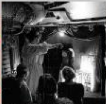
Miguelló presenta "Yelida, la mujer sin cabeza".

SINOPSIS: Es algo más que la narración de las peripecias del caudillo lusitano. Es una reflexión sobre las guerras. De cómo la lucha por el poder, la avaricia, la codicia para la misericordia con el motivo por el cual en la historia del hombre la guerra sea la norma y la paz la excepción.