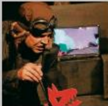
"Cuántas en verso para niños pervenios".