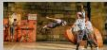
Escena de "U", a cargo de Portuqosa Teatro.

ESPECTÁCULO: "No hay burras con el amor". COMPAÑÍA: Producciones Espasmo. LUGAR: Teatro Nuevo "Fernando Arrabal". HORA: 18:00 horas. Duración: 90 minutos.