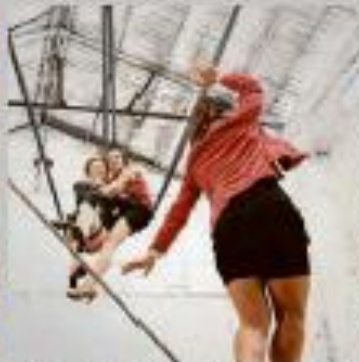
Melical presenta el espectáculo "Si punto de la F".

PRECIO: 8 euros. PÚBLICO: Público adulto. SINOPSIS: El espectáculo es una reflexión teatral sobre el intento de ser feliz en la feria medieval de hoy.