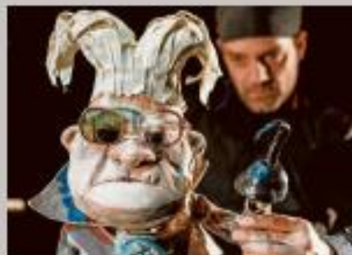
Cacena de "Adiós Pastor Pan", a cargo de Festival Teatro.

TELÉFONO DE INFORMACIÓN: La Feria pone a disposición del público el teléfono 923 48 00 03 para ofrecer información y ayuda sobre la venta de entradas (a partir de mañana, día 13, y en con los ritmos horarios que la venta).