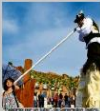
"Frog me xerto...", a cargo de Rudo Interno.

ESPECTÁCULO: "Clasicalistas". COMPAÑÍA: Imaginart. LUGAR: Sala Camark. HORA: 19:30 horas. Duración: 50 minutos. PRECIO: 0 euros. PÚBLICO: A partir de 4 años. SINOPSIS: Senda y Tonco vivan felices