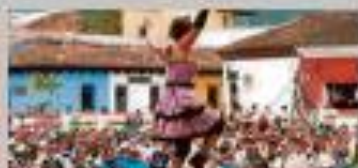
Espuma Drama presenta el montaje "Cibadón".

SINOPSIS: Comienza la acción... Entre risas y juegos, una mujer sale a escena. Todavía no está preparada. Sabe a la cuarta hora para mudar de ropa y prepararse. En el desequilibrio busca la respuesta... Espuma Drama se comunica en hablar y gesticular, así como lenguaje corporal.