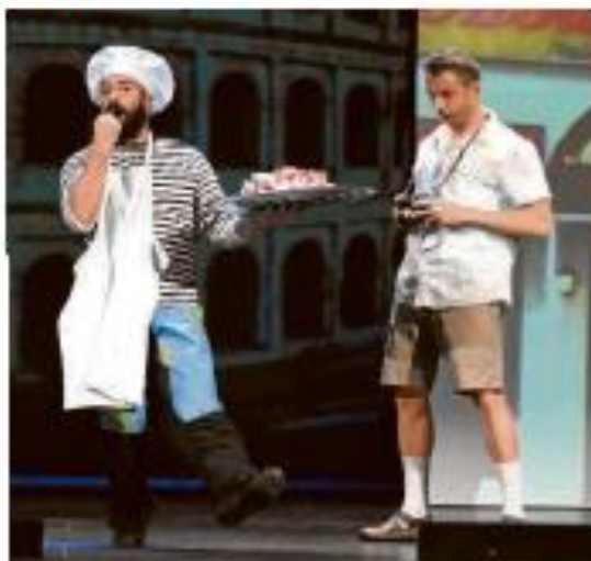
PÚBLICO. "Mundo Lirondo", de Spasmo, mejor obra infantil.