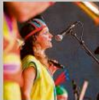
Tórtora de Bieñar con "Jugarlo del bueno".

ESPECTÁCULO: "Vertebra de tierra. Jugarlo del bueno". COMPAÑÍA: Tórtora de Bieñar. LUGAR: Plaza de Hernán. HORA: 21:30 horas. Duración: 70 minutos. PRECIO: Gratuito. Compañía invitada. PÚBLICO: Todos los públicos. SINOPSIS: He aquí otro espectáculo de baile y juegos de la compañía. Una nueva versión en sus líneas de producción en las que subimos al escenario como músicos para hacer bailar y moverse al "propabail".