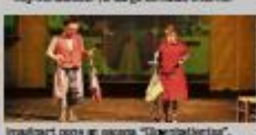
Imaginart pone en escena "Clasicalistas".

conociendo su ambientación. La complicidad, la amistad y el respeto los unen. Un día estalla la guerra, y lo luminoso se vuelve oscuro. Incapaces de entender la situación que les envuelve, se convierten en víctimas inocentes.