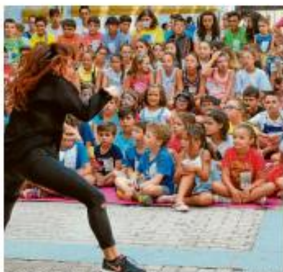
ESPECTÁCULOS. El programa incluye pequeñas obras teatrales.