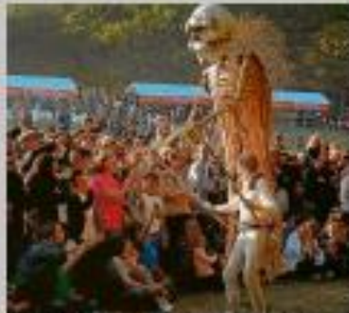
Espectáculo itinerario "Entremuerto", de Pto.

HORA: 20:00 horas. Duración: 60 minutos. PRECIO: 6 euros. PÚBLICO: Público adulto. SINOPSIS: La historia gira en torno a los amores del escudero Aquilano y la princesa Felice, hija del Rey Bermudo. Una trama con anécdotas y divertidas escenas y con un final feliz.