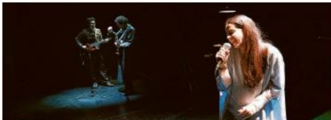
VALENCIA. La compañía La Teta Calva estrenó el espectáculo "¿Qué pasó con Michael Jackson?" que habla de la soledad, del diablito, del falso halago.