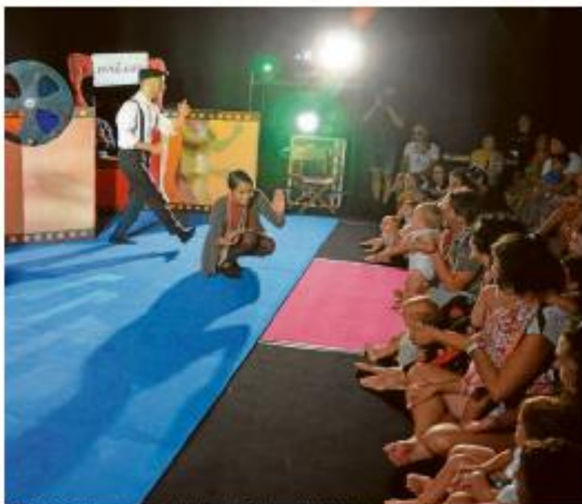
BEBES. El Espacio en Rosa de la Feria de Teatro está dirigido a la primera infancia.