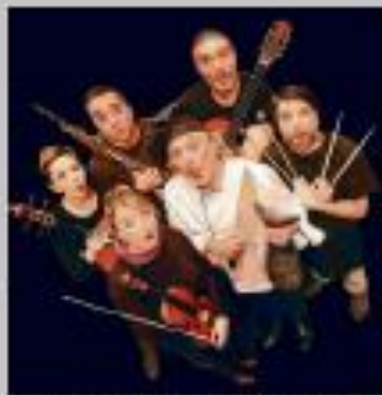
Integrantes de la compañía Teatro Ota y Mochi.

ESPECTÁCULO: "Cuantos se vino para niños perverna". COMPAÑIA: Baydrino Teatro. LUGAR: Sala Esmak. HORA: 12:30 horas. Duración: 50 minutos. PRECIO: 5 euros. PÚBLICO: A partir de 7 años.