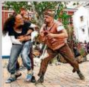
"El Galán", a cargo de The Freak Cabaret Circus.

ESPECTÁCULO: "Galán". COMPAÑÍA: Nómada Teatro. LUGAR: Sala Tamarit. HORA: 20:30 horas. Duración: 50 minutos. PRECIO: 5 euros. PÚBLICO: A partir de 4 años. SINOPSIS: Alfredo Neptuno es un talmudo pescador que regenta el negocio familiar: la pescadería "Neptuno". Aunque se ha dejado llevar por la mara de la