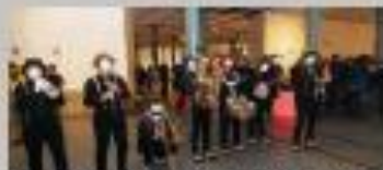
Actuación de la compañía Mimo's Delsa Band.

ESPECTÁCULO: "Mimo's Street Parade". COMPAÑÍA: Mimo's Delsa Band. LUGAR: Plaza plaza Ólivero Ledesma. HORA: 18:00 horas. Duración: 30 minutos. PUBLICO: Gratuito. Ilimitado. PÚBLICO: Todos los públicos. SINOPSIS: Es un espectáculo ambulante para la calle u otros espacios públicos. Es una animación al sonido contagioso del Ólivero en la que se representan las antiguas calles de Nuestra Orisario; tiempos felices momentos bármicos, artes circenses y una gran interacción con el público.