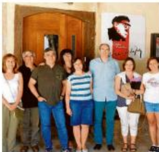
RECUERDO. Jurado de los premios "Rosa María García Cano".