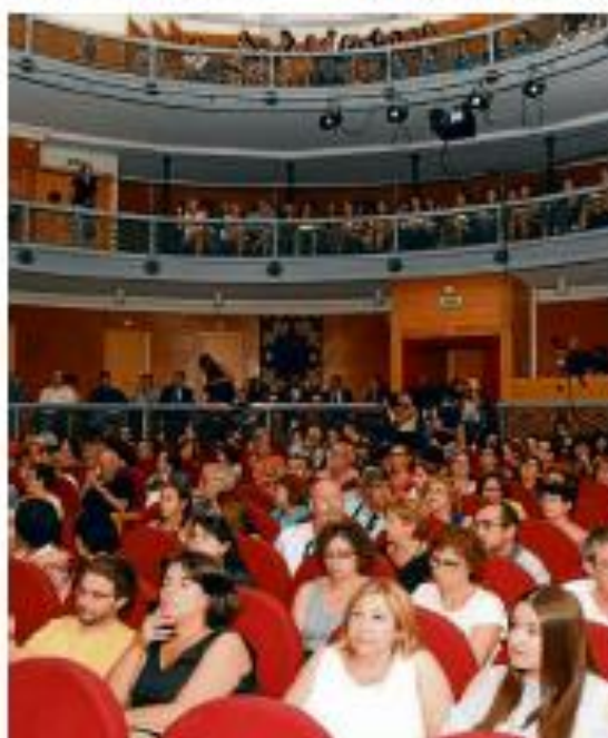
SALA. El Teatro Nuevo acoge espectáculos de teatro clásico.

La compañía de teatro barroco más importante de nuestro país, Nao d'Amoros, regresa a la Feria para montar su último espectáculo y una de sus creaciones más rodadas. En coproduc-