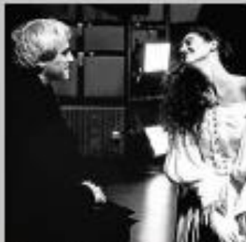
"Te estáis volviendo Chéjov", de Proyecto T&E.