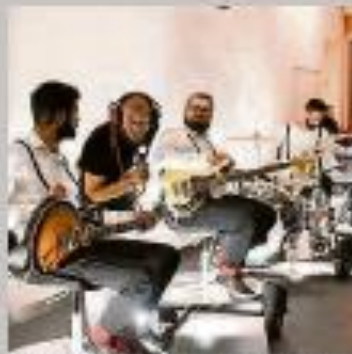
Projeto Iz presenta el espectáculo "Menusear".

ESPECTÁCULO: "Menusear". COMPAÑÍA: PROYETO IZ. LUGAR: Itinerante. Salida de la taberna (puerta de Los Sitos). HORA: 22:00 horas. Duración: 30 minutos. PRECIO: Gratuito. PÚBLICO: Público joven y adulto. SINOPSIS: El espectáculo abida a la manipulación. Entre ellos, la misma sensación de ludismo, pero también el mismo sentido lígico. Se trata de hacer una pequeña reflexión para descubrir el enigma. En este espectáculo vamos a dar verdades mirando... ¿o será de bromas? El argumento de la realidad precedida por el silencio exploto se vuelve dudoso cuando vemos una banda tocando en directo. El espectáculo pretende hacer alusión a la universalidad del teatro, todo como manipulado.