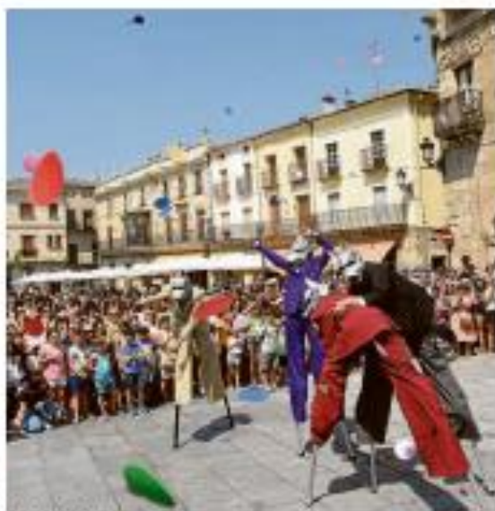
MONUMENTOS. Actuación de calle de la Feria del pasado año.

La ronda de la muralla entre las puertas del Sol y de San Pedro acogirá el día 21 una propuesta multidisciplinar de danza y mapping a cargo de la compañía búlgara Hensler, que trae dos