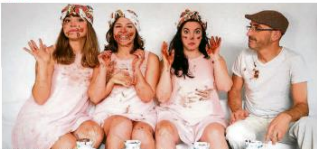
CÓMICO. "Tour Vacas 2018" es la propuesta de la compañía gallega De Vacas para el espacio de humor del patio de Los Sitios.