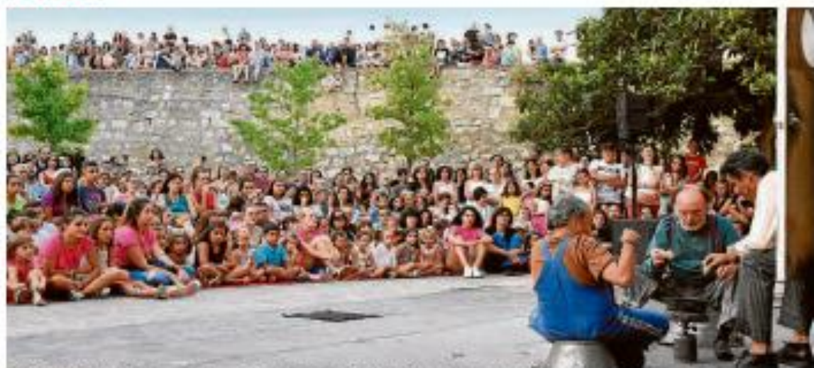
PATRIMONIO. El entorno patrimonial histórico artístico de Ciudad Rodrigo se convierte en sala escénica abierta durante la Feria de Teatro.