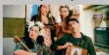
"Tour Vacasal 2018", a cargo del grupo De Vacas.

SINOPSIS: Este cuarteto musical compuesto por una guitarra y tres voces se atrae con casi todo, transformando grandes temas venerados por las masas y maltratados por la historia.