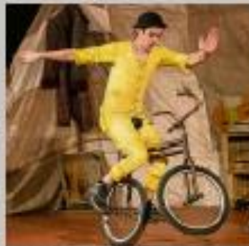
Escena de "Galer", de Jean Philippe Kéolas.

ESPECTÁCULO: "Galer". COMPAÑÍA: Jean Philippe Kéolas. LUGAR: Espacio cerrado en Plaza de Sños. HORA: 21:30 horas. Duración: 45 minutos. PRECIO: 5 euros. PÚBLICO: Todos los públicos. SINOPSIS: El montaje se inspira en la situación en la que viven muchas personas carentes de hogar, viajeros involuntarios que se ven forzados a dejar sus casas, obligados a abandonar precipitadamente de sus hogares. Narrados de nuestro tiempo que atraviesan el mundo buscando un lugar, buscando a diques sociedades y culturas, ciudades y pueblos anécdotas. Un espectáculo para todos los públicos que combina el cine con las artes circenses, a través de un universo crítico y político.